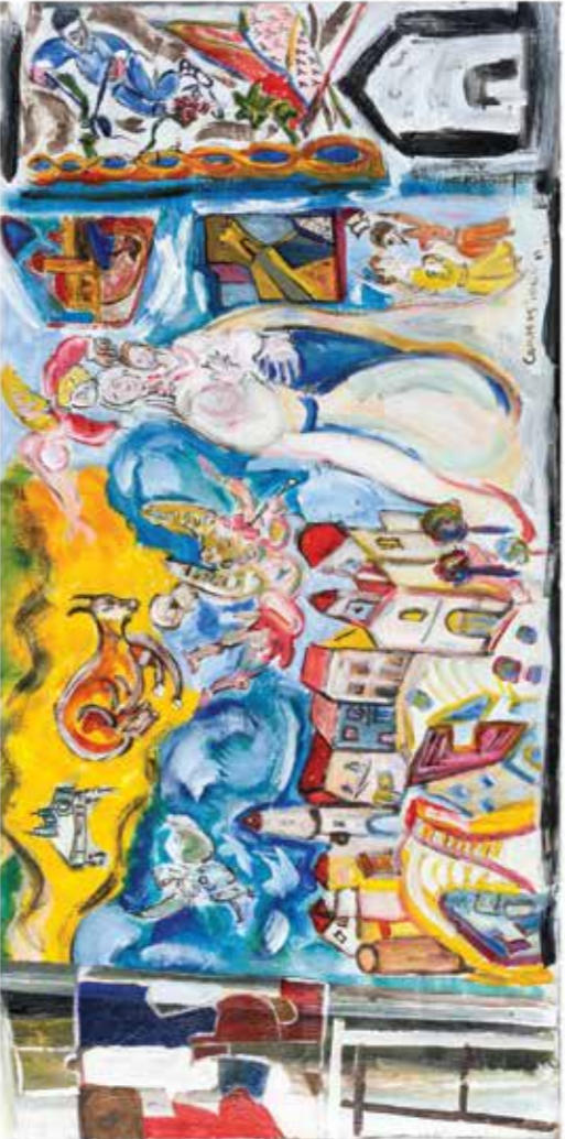
PEINTURE F. BRUNET